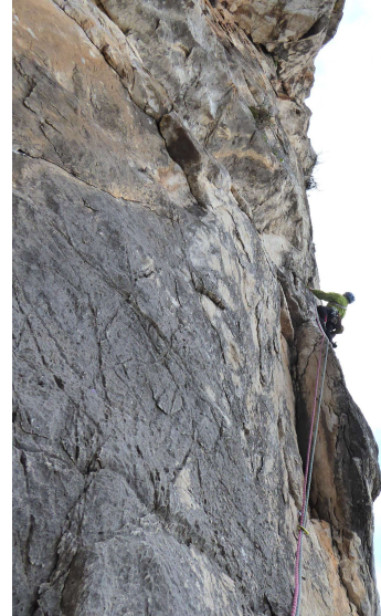
In der abweisenden Platte der 2. Seillänge