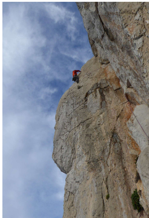
Starker Wind behinderte in der letzten Seillänge das Klettern

Wir haben noch 4 Seillängen und um 17 Uhr wird es dunkel. Ein kleiner Verhauer, der mich kurzzeitig in eine missliche Lage bringt, kostet uns wieder etwas Zeit. Der böige Wind wird immer stärker und behindert das Klettern sehr. Er zerrt an den Nerven und es ist nicht leicht konzentriert zu klettern. So ist es mir nicht möglich in der letzten Seillänge eine Schlinge um einen Felszacken zu legen. Der Wind bläst sie immer wieder nach oben. In der Dämmerung erreichen wir den Gipfel, wo uns die Freunde sehnsüchtig erwarten und die Schuhe für den Abstieg bereitstehen. Wir hatten schon befürchtet, dass die Schuhe vielleicht gar nicht da sind und wir mit den Kletterschuhen absteigen müssen.